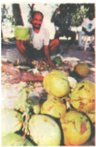
一名小贩近日在东营市东大街力街头兜售椰子。刚独立的东大街经济依然比较困难，八十万居民中约有百分之七十失业，许多人只得靠在街头兜售货物为生。

新闻热线 8328691 8331392 电子信箱: dyrb@sina.com