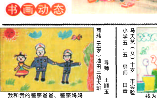
我和我的警察爸爸、警察妈妈 我为高楼画新衣

儿童节即将到来之际，市实验小学的35名“美术兴趣小组”成员在老师的带领下来到新世纪广场，共同参加了“我与画家叔叔交朋友”实践活动。