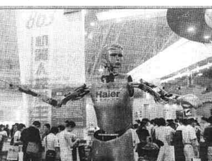
在第五届中国北京科技产业博览会上，机器人展区展示了我国工程技术人员完成的30余项机器人成果，成为展会上最抢眼、最热闹的地方。这是迎宾指挥机器人，它能运用手臂、头、眼睛、腰部完成多种运动组合，实现乐队指挥功能。

会议指出，做好今年的军转安置工作，具有特别重要的意义。2002年全国和武警部队将有3.8万多名干部退出现役转业地方工作，其中有1.1万多名干部选择自主择业。今年的军转安置工作，要按照江泽民同志的重要指示和中央的统一部署，认真落实《军队转业干部安置暂行办法》及其配套文件的政策规定，把安置军转干部作为一项重要的政治任务，认真完成好计划分配的转业干部安置工作，继续做好自主择业的转业干部管理服务，推进军转安置工作改革深入发展。