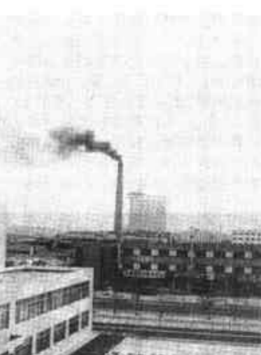
多浓重的烟雾啊!附近生活区的人们深受其害!(摄于西城)

能长时间保存，否则最多1个月左右便会彻底腐败变质。而铁罐易拉盖由于完全可以采用高温、高压杀菌处理，因而其内容的保质期一般可达一年以上。至于利乐软包装，因其整个生产过程是在无细菌污染的条件下灌装的，一般保质期在半年左右。