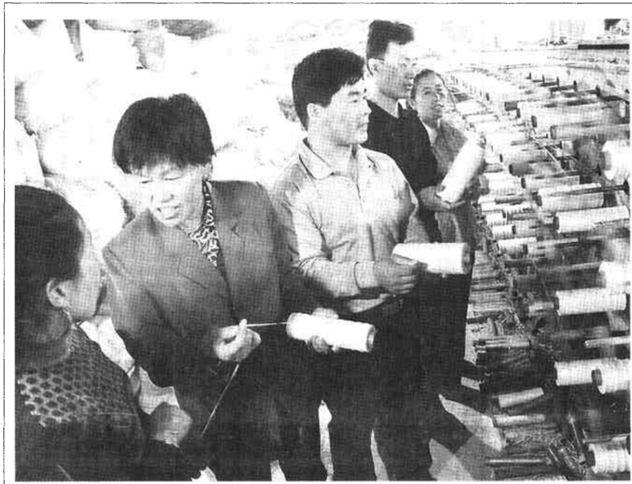
东营区史口镇小刘家村两委新班子上任后，把大力发展民营经济作为一项主要工作来抓，千方百计协调资金，扶持村民发展工业项目。图为村两委成员正在与民营经济户制定企业发展规划。

生产机械化 农民收益大 我市牧草业实现社会产值六千万元 本报讯 去年以来，我市以抓产业结构调整为契机，结合山东省牧草生产机械化示范工程的要求，高标准、高起点组织实施了农机创新工程，有效地促进了全市牧草业的发展和农机服务水平的提高。目前，全市首茬种植面积已达20万亩，首茬播种、收获、打捆机械投入达160万元，实现社会产值6000万元。 我市首茬种植面积大且成方连片，人工、小型机械收割、打捆劳动强度大、效率低，难以保证牧草收获质量，农民对实现牧草生产机械化的要求越来越迫切。为此，我市抓住省农办、省财政厅在东营实施牧草生产机械化创新工程的良好机遇，积极拓宽农机服务领域，制订优惠政策，舍得资金投入，立足高标准、高起点引进国内外先进牧草机械。2001年，共投资61万元，引进了约翰迪尔方捆机、半干打捆机及包膜机等部分先进的牧草机械，建设了利津县陈庄镇牧草生产示范点，项目的示范带动作用得到了充分展现，提高了全市牧草生产的科技含量，也使全市牧草机械化水平得到快速提升。去年，全市研制推广牧草播种机90台，推广92CX—0.84型划地机96台，9YB—1型打捆机23台，在全省率先实现了牧草生产全过程机械化。项目的实施也取得了显著的经济效益，2001年，全市共完成首茬播种面积6.7万亩，首茬机收面积4万余亩，机械打捆12万亩，半干包膜打捆1万亩，实现农机作业总收入260多万元，创利132万元。 (徐纯亮 王武军)