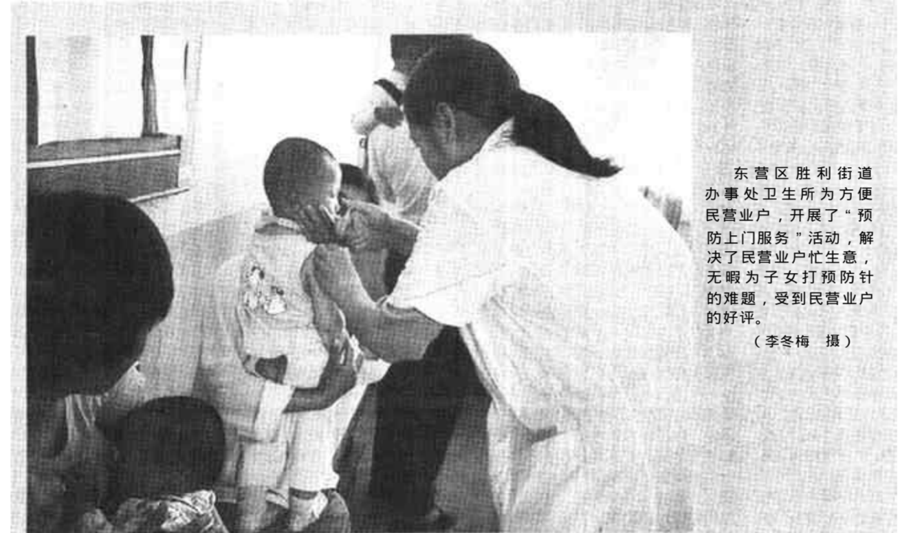
东营区胜利街道办事处卫生所为方便民营业主，开展了“预防上门服务”活动，解决了民营业主忙生意，无暇为子女打预防针的难题，受到民营业主的好评。