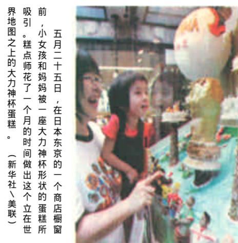
五月二十五日，在日本东京的一个商店橱窗内，小女孩和妈妈被一座大力神杯形状的蛋糕所吸引，糕点师花了一个月的时间做出这个立在世界地图之上的大力神杯蛋糕。