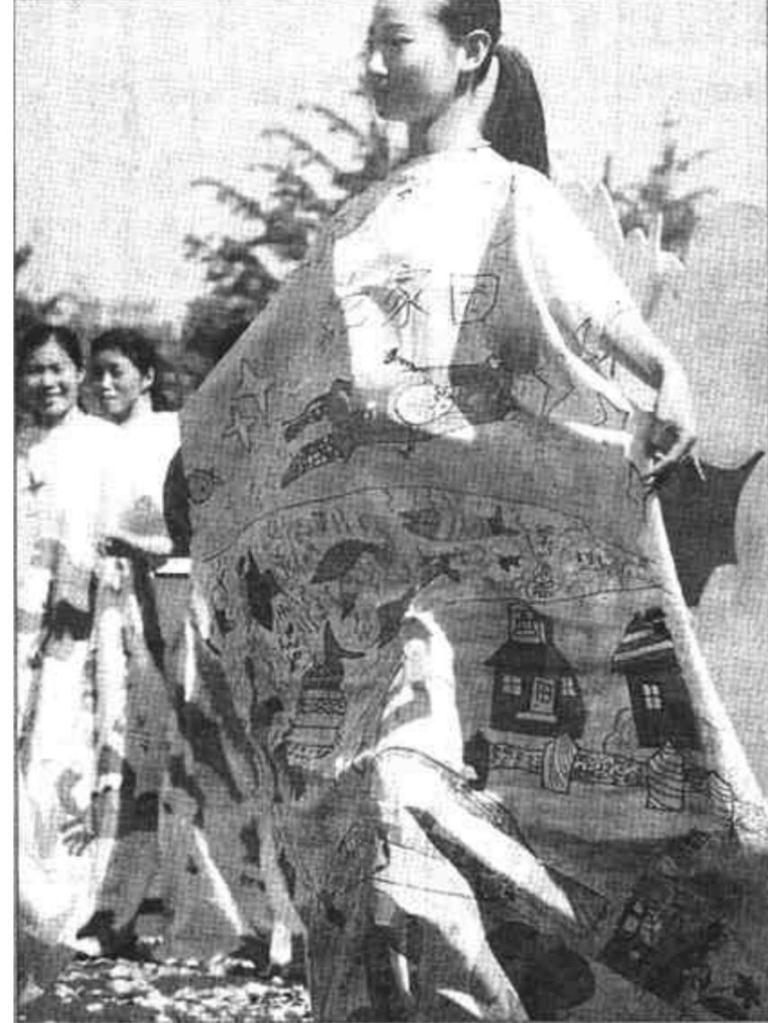
“六一”国际儿童节前夕，“心系好儿童”活动组委会在北京石景山游乐园举办“我是健康小天使”儿童健康教育系列活动。这是幼儿教师们在展示由北京百家幼儿园的小朋友共同绘制的“孩子眼中的21世纪一百米绘画长卷”做成的时装。