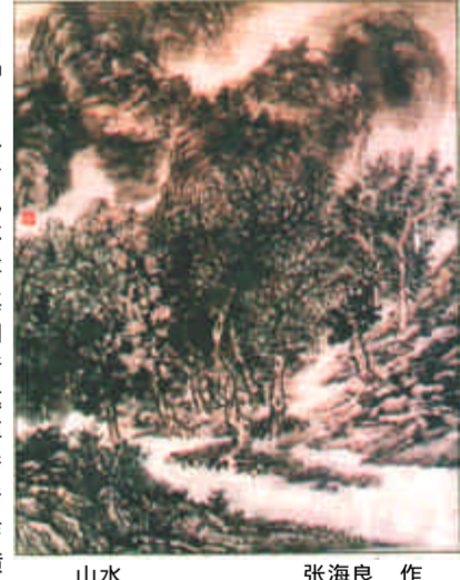
山水 张海良 作

朴品质是分不开的。从张海良山水画的创作历程来看，笔墨中表现出来的质朴因素，在最开始的时候，可以说还处在一种不自觉的状态。也许画家早已意识到了这一点，为了解决创作和笔墨风格之间的矛盾，张海良曾两次到中国艺术研究院研修学习。在这里，他坚定了自己的创作追求。特别是陈绥祥先生在谈到中国画的创作和文化品位的追求时，对张海良的影响是相当明显的。他正是从这里进一步醒悟到他应该做什么，应该追求什么，那就是和自己的个性保持一致，不懈地追求一种质朴的纯正的山水画品质。（邱正伦：西南师范大学美术学院教授，著名诗人、文艺理论家）