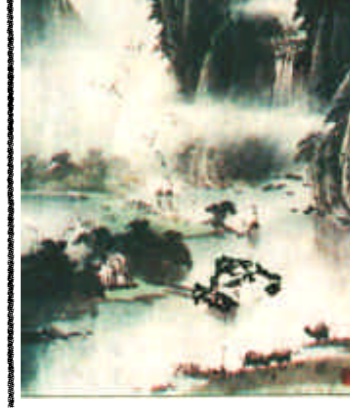
市实验小学三·二 导师 石建勋 映日 石李一帆 十五岁画